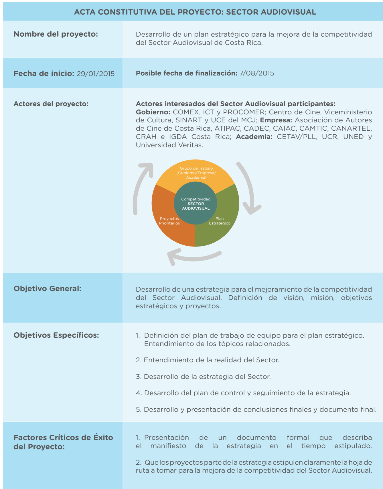
Tabla 1: Acta constitutiva del proyecto: Sector Audiovisual